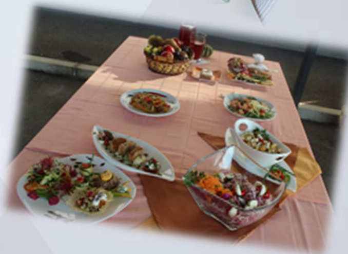
Tekmovanje zaposlenih v pripravi zdravih jedi