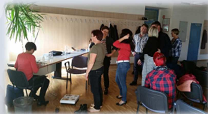
Meritve dejavnikov zdravstvenega tveganja