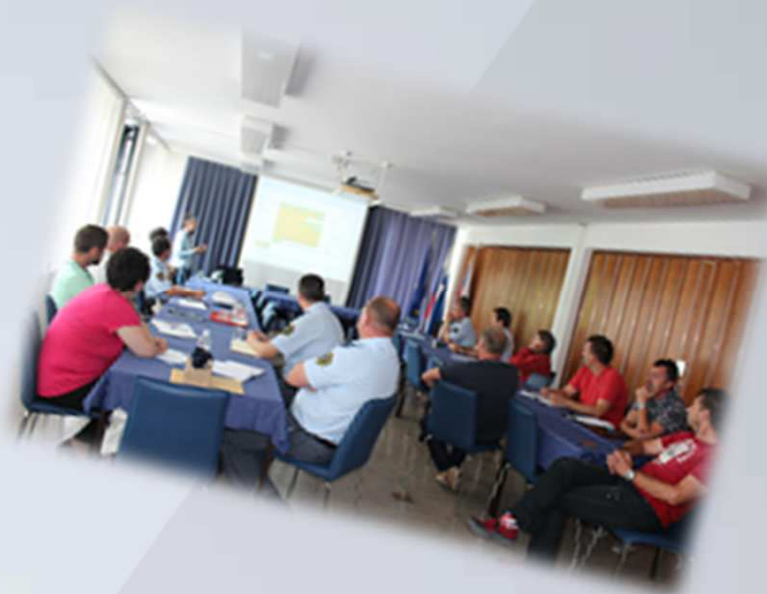
Predavanja na temo “ Nalezljive in nenalezljive bolezni ”