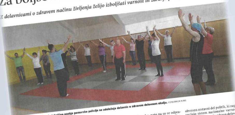
Predvsem administrativno in tehnično osebje pomurske policije se udeležuje delavnic o zdravem delovnem okolju.

Z delavnicami o zdravem načinu življenja želijo izboljšati varnost in zdravje pri delu