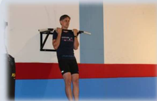
Predavanja in praktična izvedba na temo “ Zdrav način življenja ”