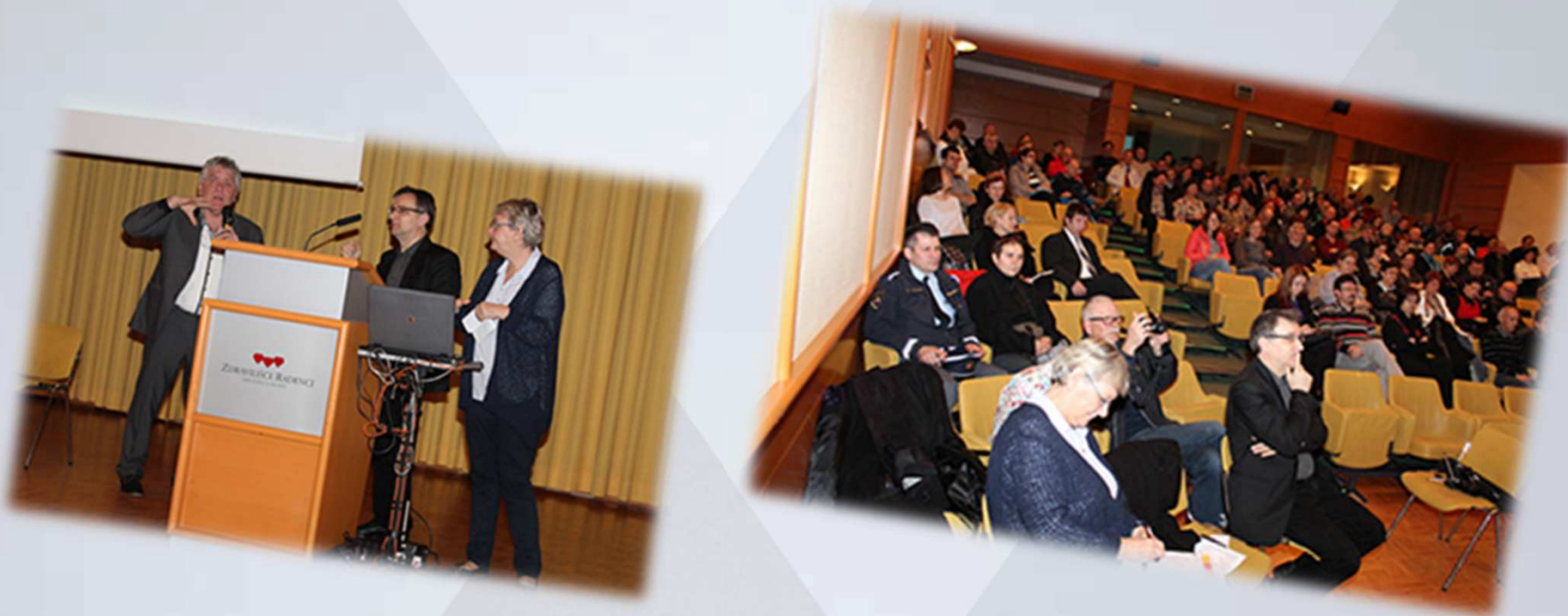
Udeležba na delavnici na temo " Alkohol in rehabilitacija "