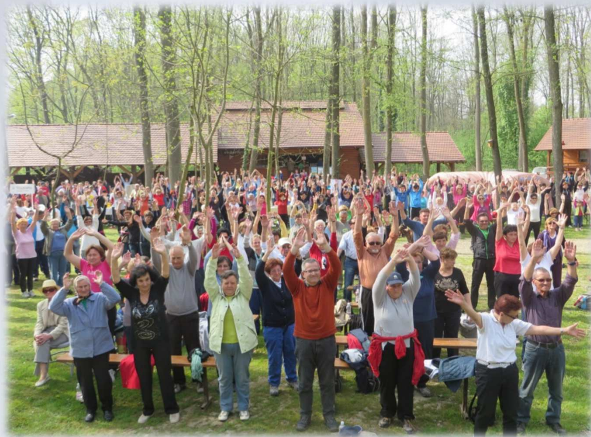
Soudeležba na prireditvi ob Svetovnem dnevu zdravja - Otok ljubezni - Ižakovci