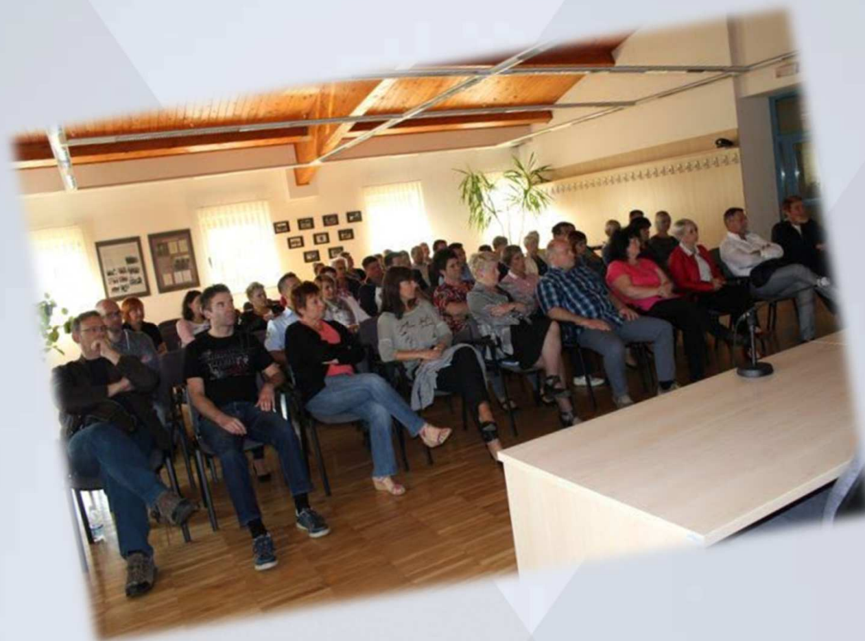
Predavanja na temo “ Zdrava hrana in zdrave prehranjevalne navade “