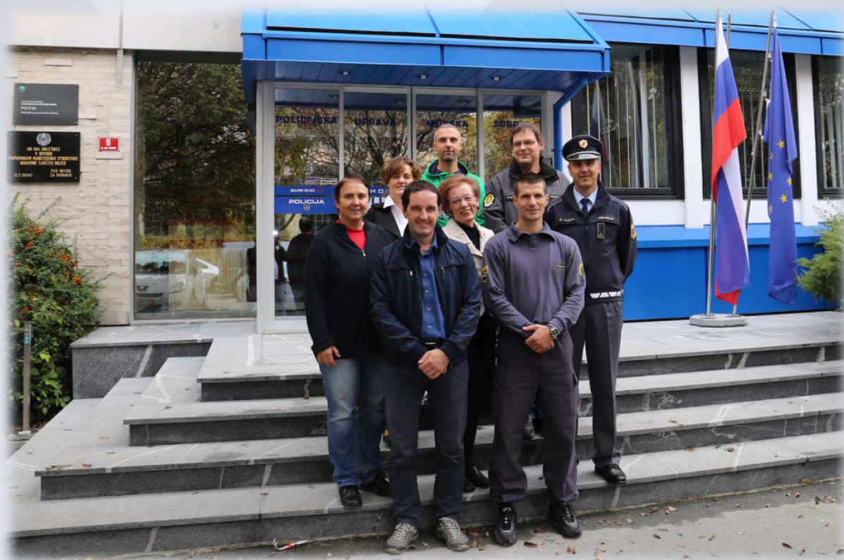
Delovna skupina za "Promocijo zdravja na delovnem mestu" na PU Murska Sobota