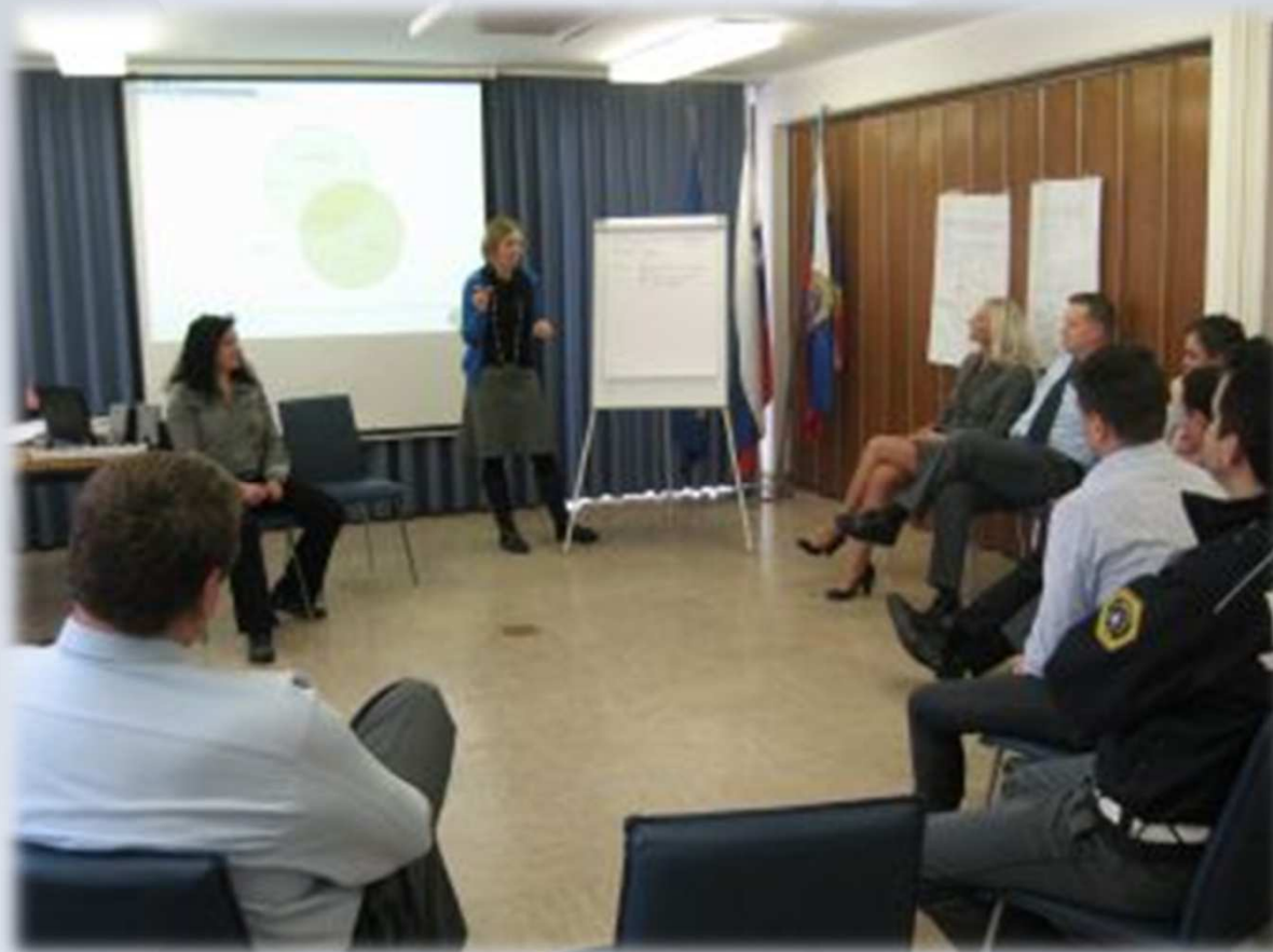
Delavnice na temo “ Stres na delovnem mestu ”