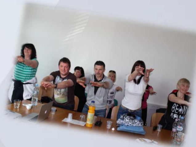
Delavnice na temo " pravilno sedenje ter aktivni odmori med sedenjem "