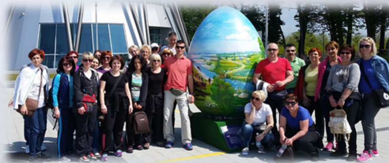
Aktivni pohodi za strokovno tehnično osebje