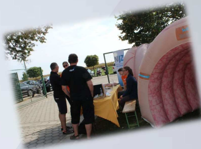
Športne igre Policije v Odrancih s predstavitvijo programov SVIT, ZORA in DORA